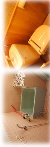
※早通駅まで徒歩5分・洋式水洗・全居室収納有り